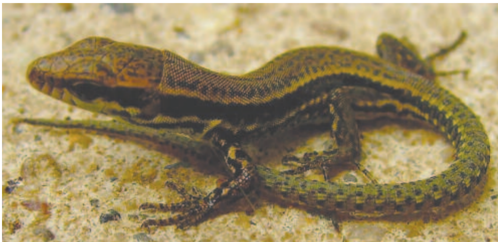
Fiatal fali gyík (Podarcis muralis) kúszik fel a kert rég otffejejtett betondarabjára

A Szűz (Virgo) csillagkép legfényesebb csillaga a nappálya szomszédságában pislogó Spica, a Kalász. Neve mezopotámiai – abból az időből származik, amikor a kalász beérését az égi Kalász aranyba, fénybe öltözése jelezte. A kalászos Szűz már a klasszikus ókorban sem felelt meg jelzői szerepének, annak ellenére, hogy az európai civilizáció-központ is közben lassan északra tolódott, s ezáltal az aratás időpontja is későbbre került, követve az őszpont felé mozduló csillagképet. Valamikor a közel-keleti „neolitikus forradalom” idején, a Kr.e. 7–5. évezredben adhatott jelt a Kalász az aratás megkezdésére. A legrégebbi olyan ábrázolások, amelyeken a „szűzanya” látható a méhéből sarjadzó kalással, vagy sugaras hajú nap-, illetve kalászgyermekkel, amint épp a világra szüli, vagy közösi vele, ennek a korszaknak a végéről maradtak fenn. Erre az időre „emlékszik” vissza Vergilius IV. eclogájában , amikor a sarlós Saturnus aranykorát, a Szűz uralmát énekli, és visszatértét jósolja meg, amiért is a keresztény utókor „tisztelőbeli kereszténynek” tekintette.