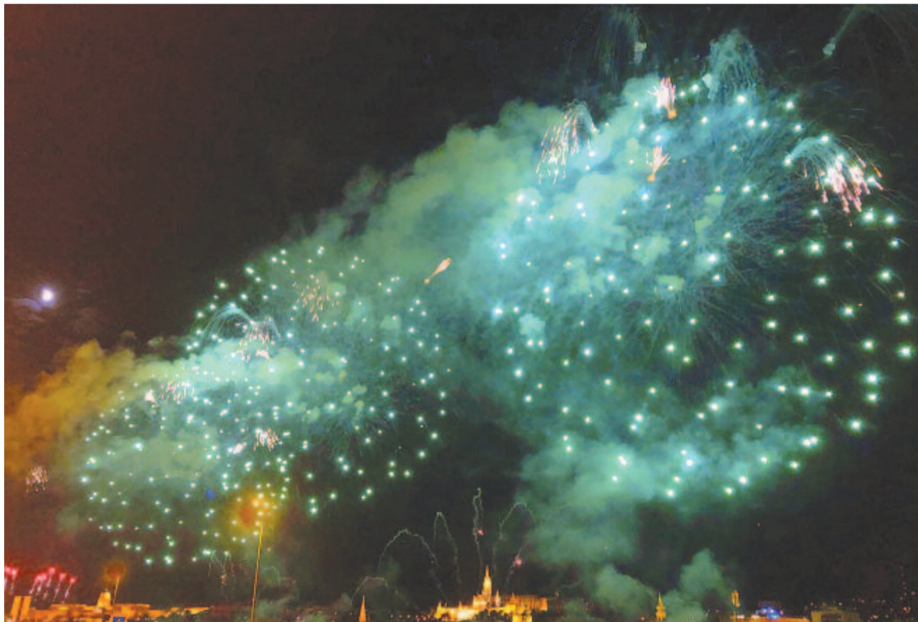
A halovány Hold csodálkozva és irigykedve nézi a földi hullócsillagok tobzódó táncát

Kelt 2018-ben, 150 évvel Fenichel Sámuel születése után