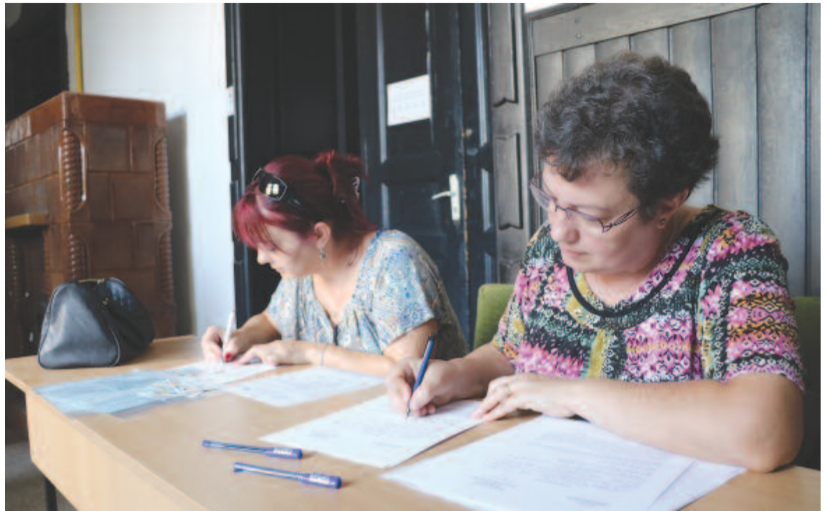
Folyik a beiratkozás