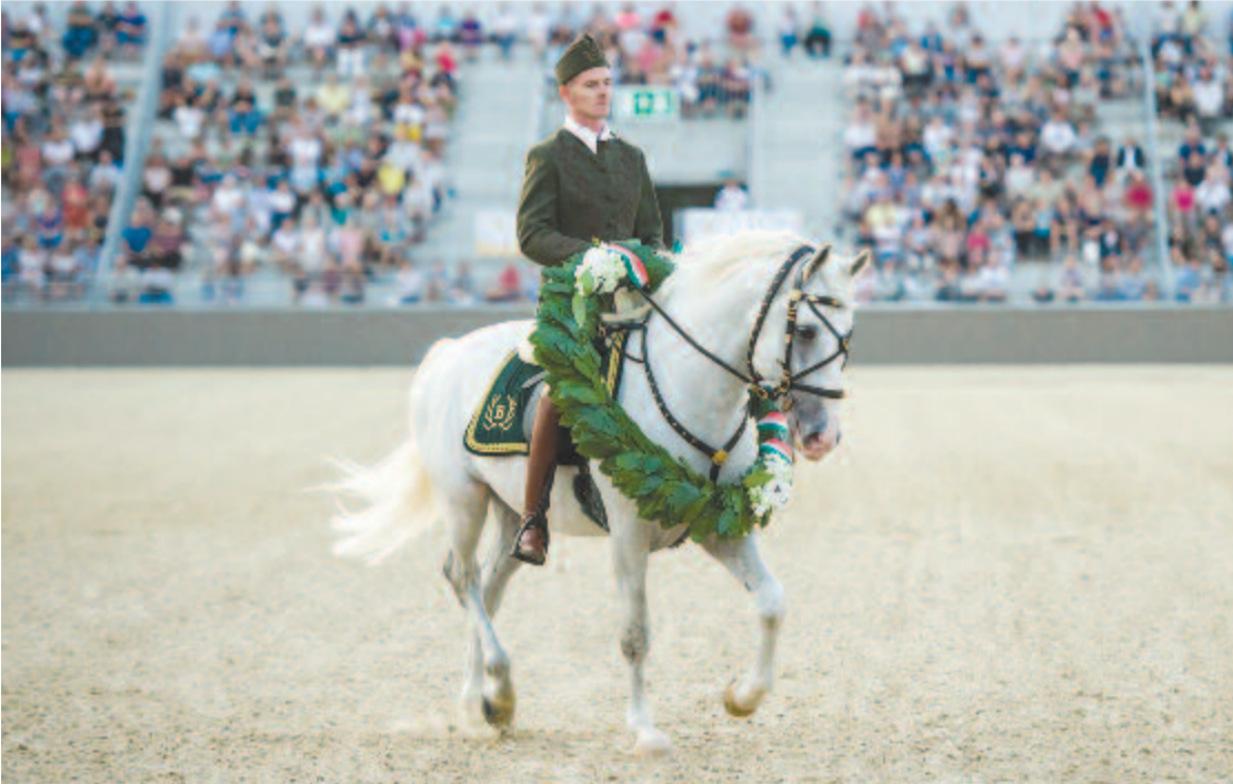
Egy lovas az új lipicai lovasközpont megnyitóján Szilvásváradon 2018. augusztus 18-án.

kiváló nedvességelvezető és ló-lábkímélő – fogalmazott. Az ország szerte 6 telephelyen mintegy 300 lovat tenyésztésben tartó, a takarmányt saját területein maga termelő ménészgazdaság alapvető célja, hogy Szilvásvárad a lovasoktatás és -kutatás hazai központja legyen. A most átadott létesítményegyüttes többfunkciós kialakítású, így nem csupán lovas, de egyéb kulturális programok megrendezésére is alkalmas – hangsúlyozta az igazgató. Horváth László, a térség országgyűlési képviselője a tájékoztatón arról beszélt: régen várt pillanat és ünnep ez az esemény Szilvásváradon, a településnek több mint hétezer éves múltja és három ezer éves lovas kötődése van. A magyarok kultúrájának szerves része a ló szeretete. „Lovas nemzet vagyunk, ez pedig olyan alapértékünk, melyet nem hagyhatunk veszni” – mondta. (MTI)